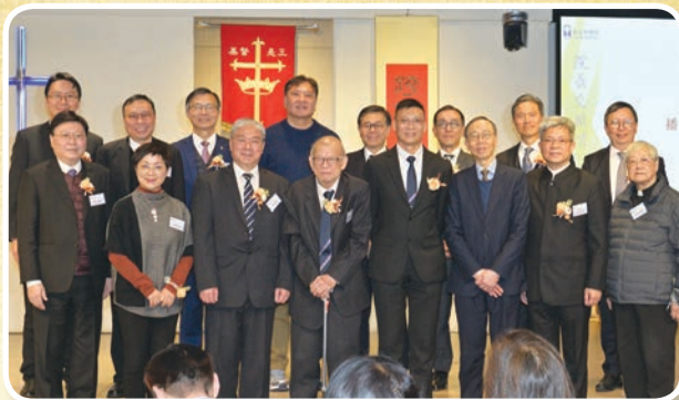
感恩崇拜主禮人合照