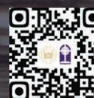
新生入學申請 及科目報名