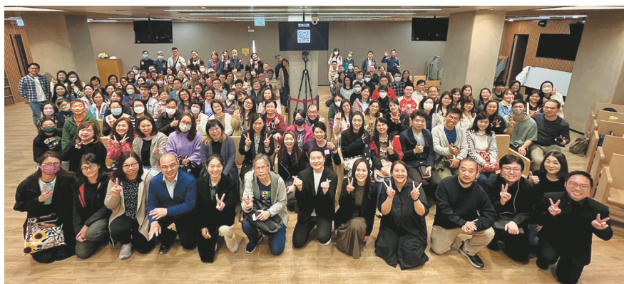
全體大合照，大家都滿載而歸！