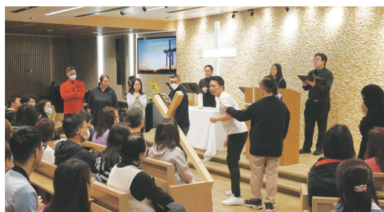
崇拜學同學和與會者用默劇和音樂演繹十架苦路。