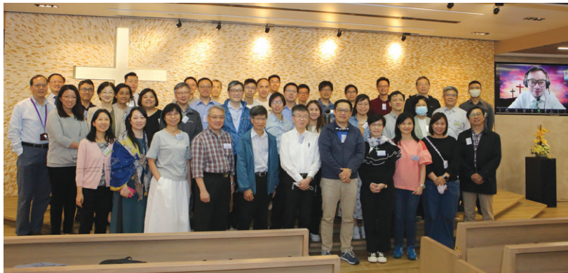
實習督導交流會大合照