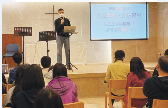
文見歡副院長於《逆風啟航晚會》分享信息