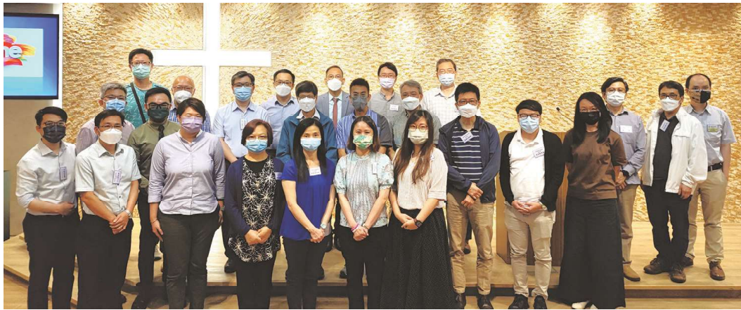
實習督導團與本院老師合照

在第五波疫情呈現穩控局面的稱況下，政府開始第一階段放寬部份社交距離措施。本院於4月25日順利舉行新一次實習督導交流會。感謝21位督導撥冗出席，並分享疫情期間的牧養及督導的心得。藉着是次交流會，本院就實習教會之牧者對神學生的悉心栽培，深表謝意。